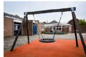
De Zaaier 073-5991783 www.dezaaierhedel.nl info@dezaaierhedel.nl