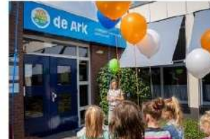
De Ark 0418-672466 www.arkzuilichem.nl mm.vanvugt@arkzuilichem.nl

SAMEN BOUWEN WIJ AAN DE TOEKOMST VAN ONZE KINDEREN!